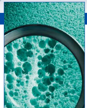
Активно дышащая, регулирующая влажность пористая структура, по строению напоминает натуральную губку

Матрасы BULTEX® из группы продуктов SCHLARAFFIA созданы по самой успешной, изобретенной в 90-е годы технологии производства матрасов. Секрет успеха заключается в необычных свойствах материала. Технология его производства уникальна в Европе, запатентована и отмечена призами. Достигнуты значительные результаты в области комфорта, климатизации и экологии. Именно на этих основах SCHLARAFFIA создала BULTEX®plus, обладающий революционно новыми преимуществами, которые обеспечивают идеальную поддержку тела для здорового сна.